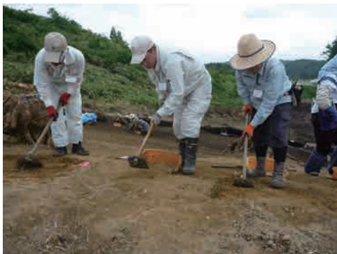
5 面整理 ジョレンなどを使って地面を削り、土の色や質の違う「遺構」を見つけていきます。