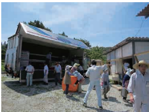
1 機材搬入 上山市の埋蔵文化財センターから発掘調査に使用する機材を運んできます。

埋蔵文化財センターの発掘調査について紹介します。 写真は、去年～今年度行われた発掘・整理の様子です。 一口に発掘調査と言っても、いろいろな工程があります。 みなさんも、ぜひ間近でご覧になってください。