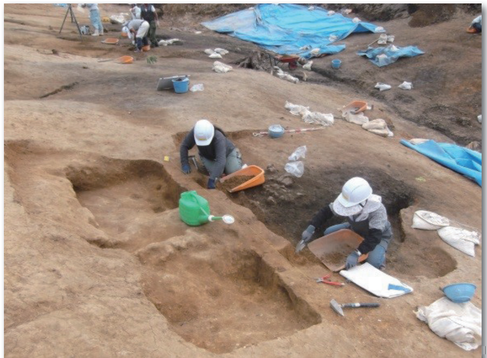
製鉄炉調査風景 画面左側の窪みは、炉に風を送る「ふいご」の跡。人がいる右側の黒いしみが炉本体。(天化沢A遺跡)

仙台と東京を結ぶ常磐自動車道の建設に伴い調査された南狼沢 みなみおいざわ A遺跡は、宮城県との県境の新地町に立地する遺跡で、平安時代の終わりごろから鎌倉時代のはじめにかけての製鉄炉を発見しました。この時期の製鉄遺跡は、福島県では発見例がなく、製鉄炉の形や