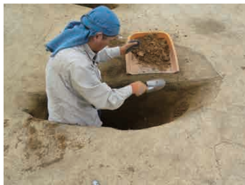
8 遺構精査 土の埋まり方を確認するため、遺構の半分だけ掘り下げる場合もあります。