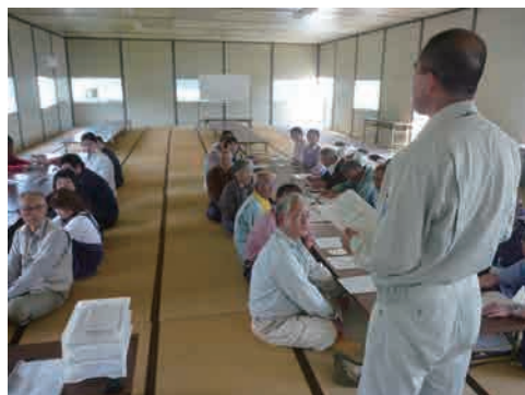
2 オリエンテーション 発掘調査についての注意事項・約束事・諸手続き等を説明します。