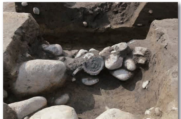
5 区溝跡から出土した瓦です。軒丸瓦には巴紋 ともえ が ついていました。