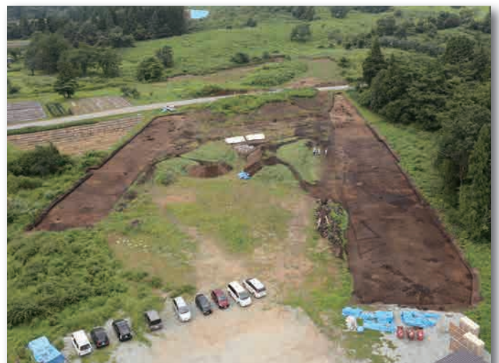
清水遺跡旧(3)調査区の全景写真です。今年度は、東北中央道の東西に付くスマートIC部分を調査しました。西側に多くの建物跡があります。