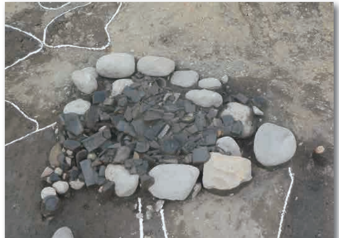
調査区の北西側の L 区から、大量の瓦が投げ込まれた石組み施設が検出されました。

遺物としては、16 世紀末～17 世紀初頭に佐賀県の唐津で焼かれた陶器類が出土しました。中には完全な形のものも含まれており、最上氏の時代に関係した遺物と思われま