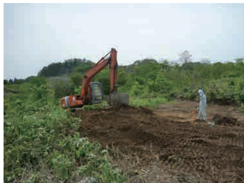
4 表土除去 遺跡を覆う表土を取り除きます。深さは遺跡によって様々です。