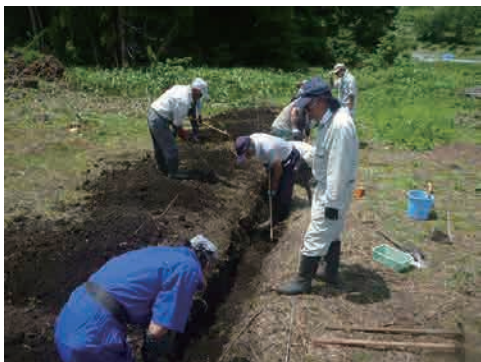
3 調査区設定 発掘を行う区域を設定します。周囲を掘って、遺跡の深さを確認する場合があります。