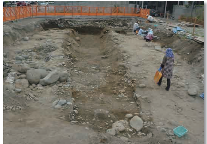
5 区区画溝完掘状況。南北方向に伸びています。幅 4m、深さ 1 m ほどです。

5 区と 1 区は遺構の残存状況が良好でした。5 区からは、南北方向の大きな区画溝が検出されています。掘った後に壁面を砂で固めて整形していたこともわかりました。ま