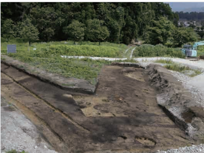
清水遺跡旧(1)調査区です。Y字の狭い調査区から2棟の竪穴住居跡が見つかりました。手前の住居は南東隅にカマドが造られています。

地点に集落が点在したと考えられます。南には丘陵部に住居が並び、低地に構築した溝を灌漑や排水に利用した集落が存在し、北には、丘陵斜面上に住居や掘立柱建物跡を建てた集落、さらに隣接して北に、溝で区画した建物群が立ち並んでいたと推測されます。建物や住居の重複と、出土遺物から、短い期間での変遷が窺え、堆積していた火山灰から10世紀初頭には、各集落は廃絶していたと思われます。(氏家信行)