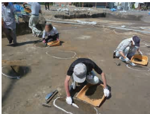
7 遺構精査 面整理で見つかった遺構を、移植ペラなどを使って少しずつ掘っていきます。