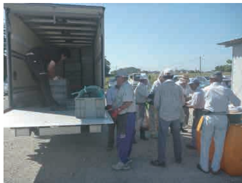
12 機材撤収 機材を撤収し、現場での調査は終了になります。お疲れ様でした。