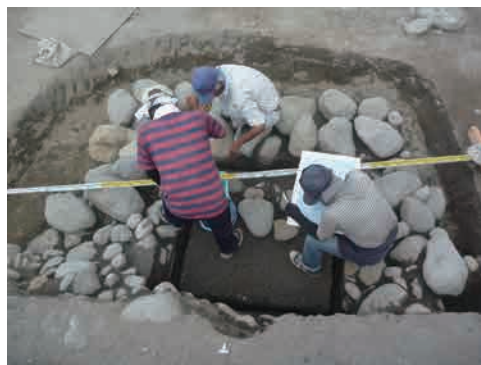
10 遺構実測 図面への記録作業です。ここでは、井戸跡の平面図を記録しています。