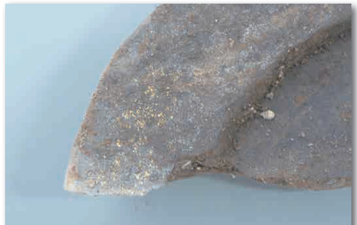
N 区で出土した金箔瓦です。表面の金色の粒々が金箔を貼った痕跡と考えられます。