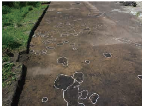
6 遺構検出 見つかった遺構に白線を引いてわかりやすくします。