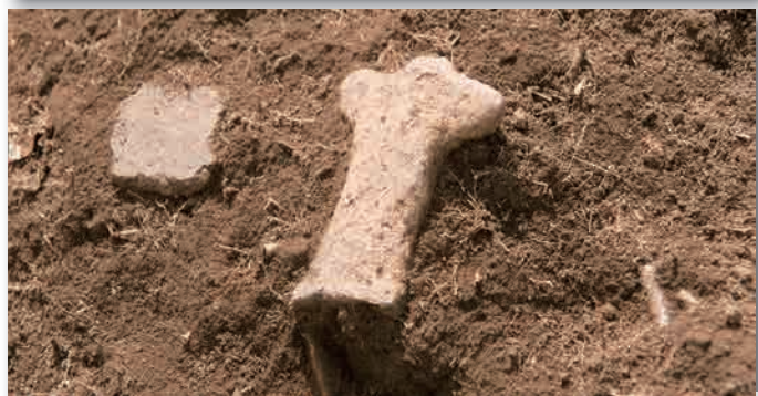
4 区 2 層出土の土偶