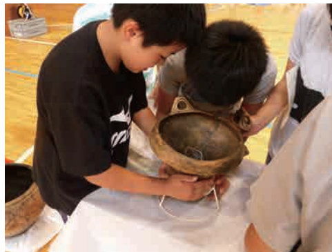
14 出前授業などでの活用 発掘調査で出土した遺物や整理作業で分かったことを、普及啓発事業に活用します。