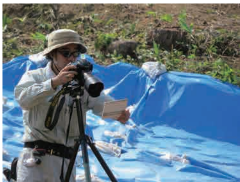
9 写真撮影 写真による記録作業です。ラジコンヘリコプターで上空から撮影したりもします。