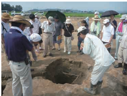
11 調査説明会 調査の終盤には、現地において調査説明会を開きます。