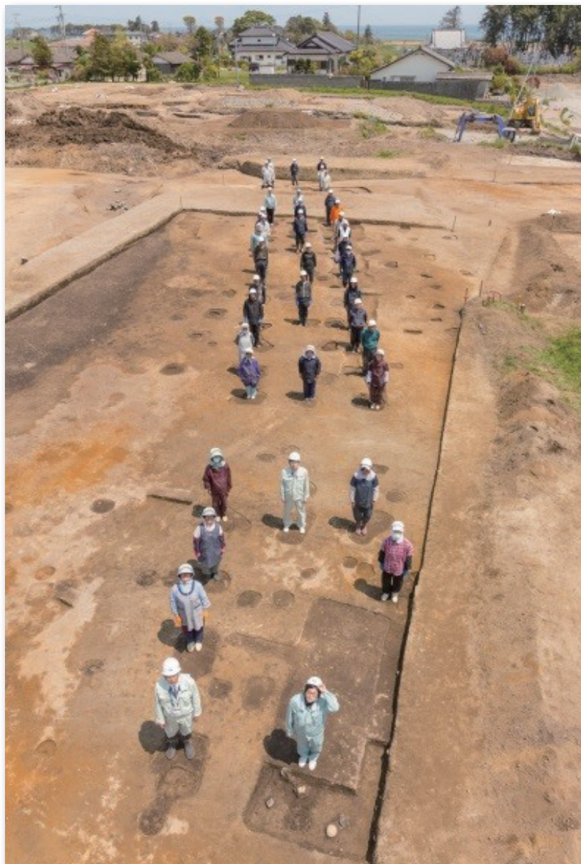
規格的な建物群人が立っているのが建物の柱穴跡。直線的に4棟並んでいるのがわかります。(桜田IV遺跡)

また、広野町の桜田IV遺跡からは、古代の集落跡が発見され、その中でも規格的に並ぶ建物群は、古代の街道沿いに設置された「駅家」の可能性を示唆するものではないかと注目されます。遺跡では、地元中学生らによる体験発掘や現地説明会などが行われ、緊急性の高い復興事業に伴う調査ながらも、住宅移転計画は一部見直され、建物跡の密集する区間は、公園として整備し、保存されることとなりました。