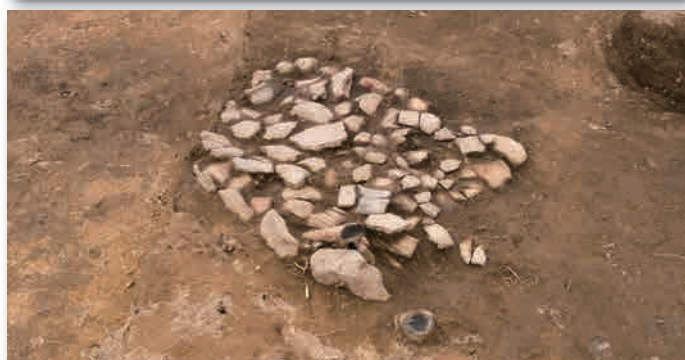
3 区 2 層検出の石囲い炉

大型のものからミニチュアなものまであります。土偶は、5 体あるいは 6 体発見されました。そのうち 1 体は、完全な形に復元できます。ほかには、大型で精巧な文様が施された土偶 どぐう の脚部や腰部もあります。また、土偶以外には、袋状土製品も出土しました。