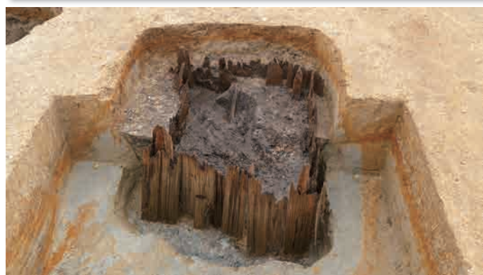
木製の井戸枠の中から曲物や陶器が出土しました。