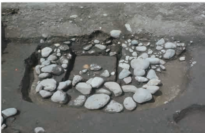
K 区で検出された近世の石組み施設で、中央が四角形に木材で囲まれており、井戸跡であったと考えられます。

江戸時代には武家屋敷となっていた一帯は、古代から既にある程度の規模の集落が存在しており、そうした集落を基盤に城下町が形成され、近代の山形市街地につながったと考えられます。今回調査した三の丸跡の北西側は、16 世紀末～17 世紀の遺物が多く出土したことから、比較的古い時期に田畑となったため、後世の開発があまり進まなかったと考えられます。（小林圭一）