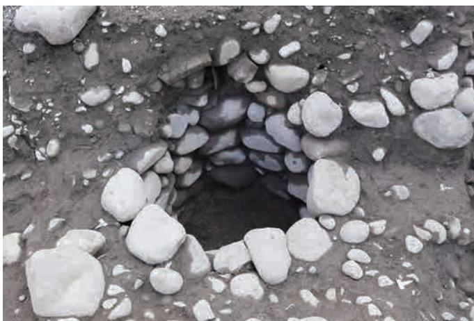
5 区の石組の井戸。江戸時代の末に作られたようですが、明治時代まで使われていたようです。