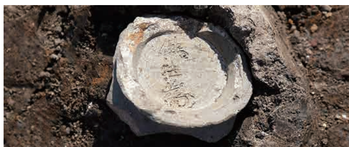
底部に「佛法為」と刻まれた須恵器の小型壺