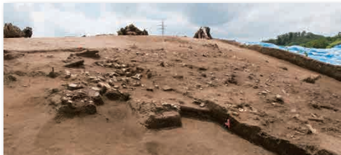
4 区 2 層遺物出土状況