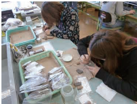
13 整理作業 発掘が終われば、調査報告書刊行に向けて、センターで整理作業を行います。