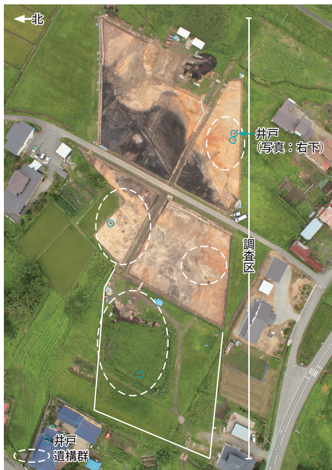
調査区の中央部に旧河道があり、その両側に井戸や土坑などが検出されました。

調査区内で見つかった遺構・遺物は多くはありませんが、調査区の北側に重要な遺跡が存在していることを示す資料が見つかったことが大きな成果と言えます。(水戸部秀樹)