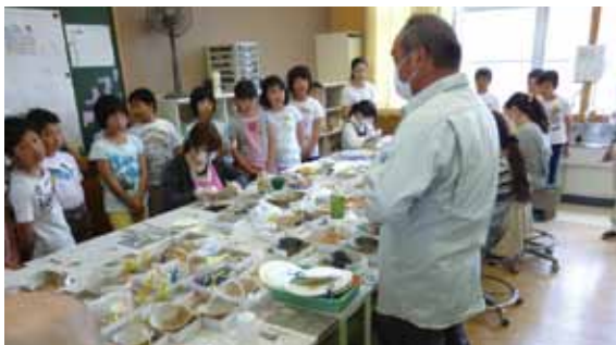
4/30 上山市立南小学校5年生 センター見学