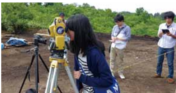
6/30 山形県立霞城学園高校 発掘現場見学

見学・研修等でのご利用のお申し込みは、随時受け付けておりますので、お気軽にお問い合わせ下さい。