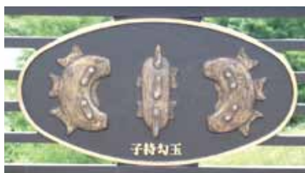
落合橋のレリーフ