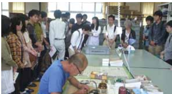
6/12 東北大学考古学研究室 センター見学