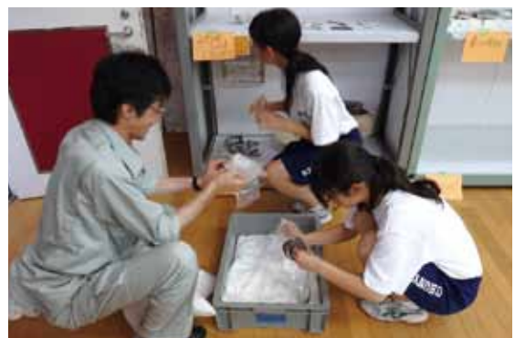
7/7~9 上山市立南中学校 職場体験