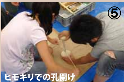
⑤ ヒモキリでの孔開け

④ できあがった「凹石」の削り跡を、ルーペで観察すると、遺物にあったものと、よく似た痕跡が確認できました。