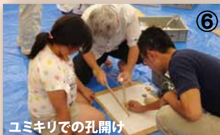
⑥ ユミキリでの孔開け

「凹石」には、凹みの中心に柔らかい球状のものが回転してできたと思われる痕跡も観察されました。遺跡から出土した石キリや石製品の痕跡とを考え合わせると、「凹石」を使ったユミキリ、あるいはヒモキリのわざが考えられます。