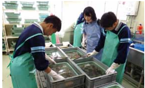
5/19~21 山形市立蔵王第一中学校 職場体験