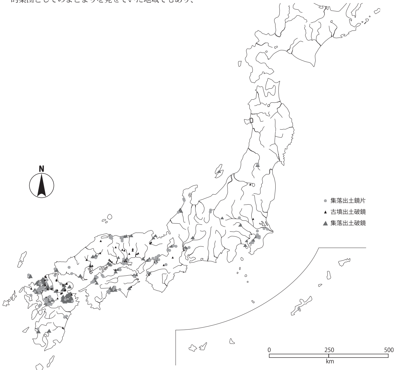
図4 破鏡・鏡片(集落出土)分布図

なお、本稿をまとめるにあたり、多くの方々から指導並びに助言を得た。また、多くの文献から引用させていただいたが、紙数の都合により、氏名及び文献名は割愛させていただいた。