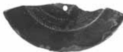
図2 馬洗場B遺跡出土破鏡（内行花文鏡）